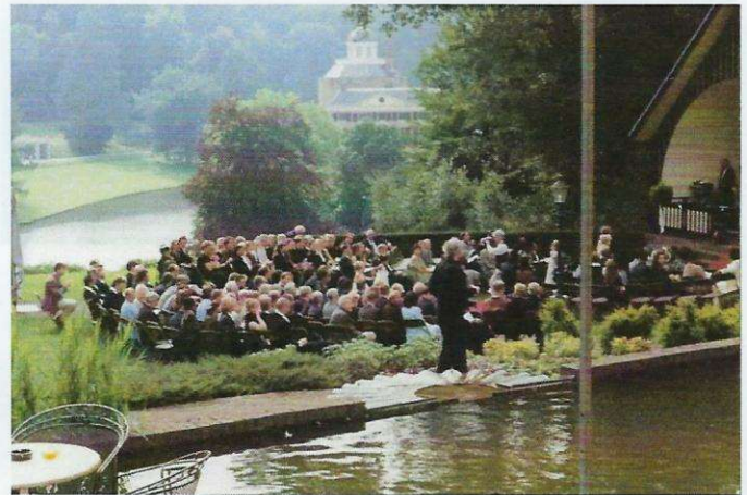
Publiek bij concert 2008

Heden ten dage wordt de muziekkoepel nog steeds volop gebruikt: op Hemelvaartsdag speelt de Koninklijke Rosendaelsche Kapel tegenwoordig in de Koepel, waar