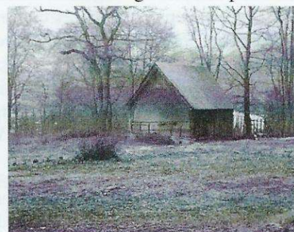
Triest beeld van tuin en muziektent 1990